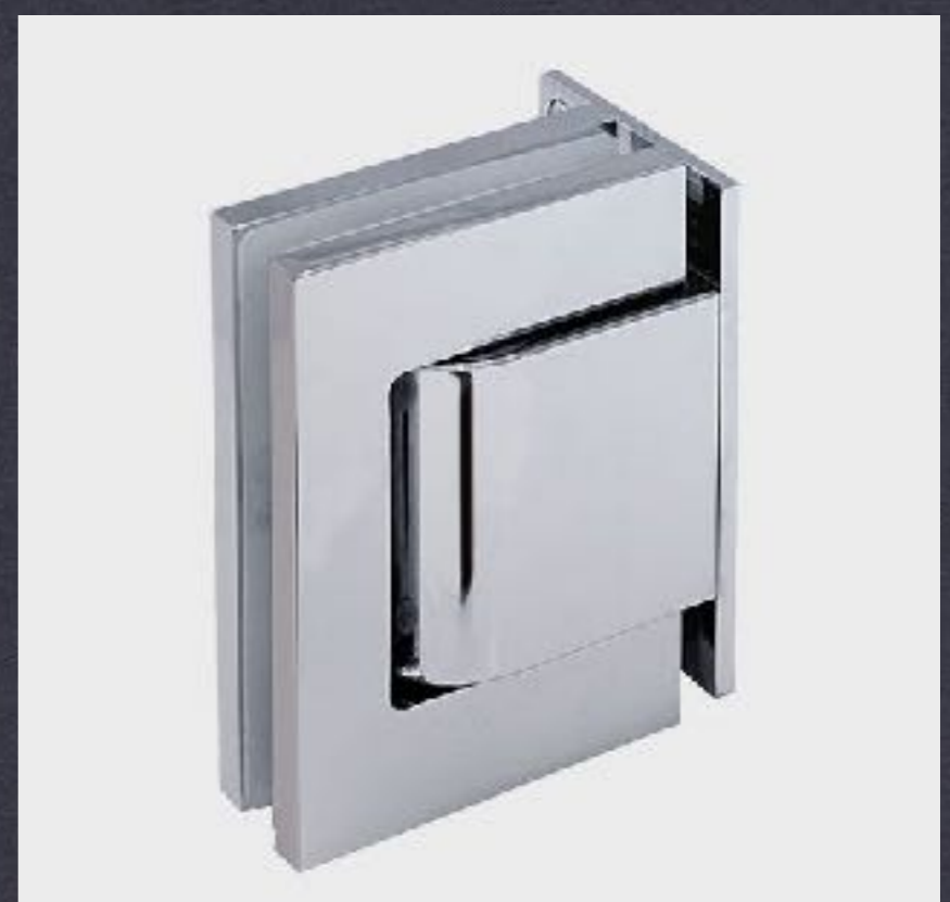
HIDROBI | BISAGRAS CON REGULACIÓN HIDRÁULICA